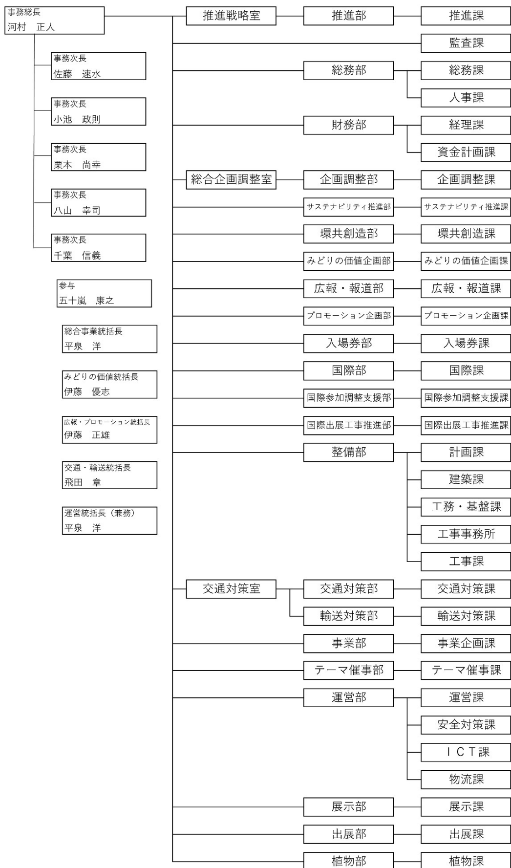
事務局組織図（2026年2月1日時点）