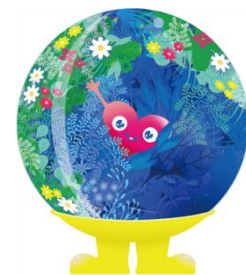
公式マスコットキャラクター 「トゥンクトゥンク」