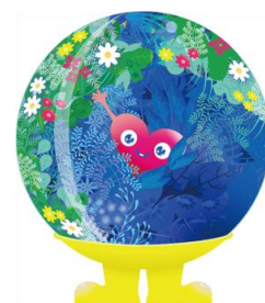
公式マスコットキャラクター 「トウククトウク」