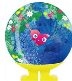
公式マスコットキャラクター 「トゥントゥンク」