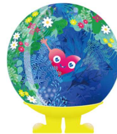
公式マスコットキャラクター 「トゥンクトゥンク」