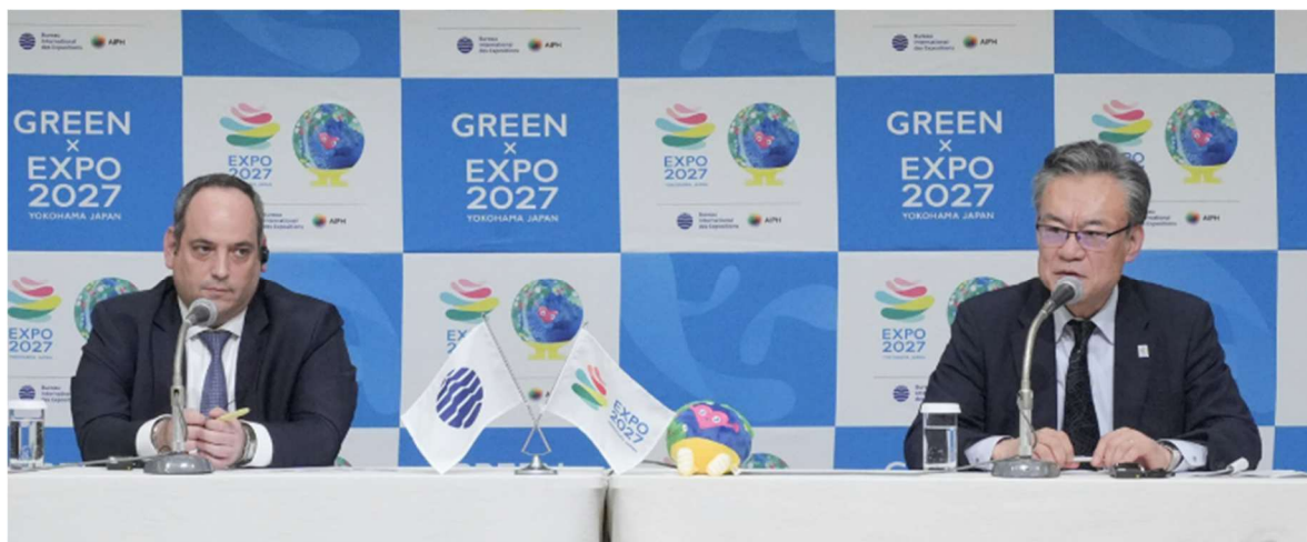
共同記者会見の様子