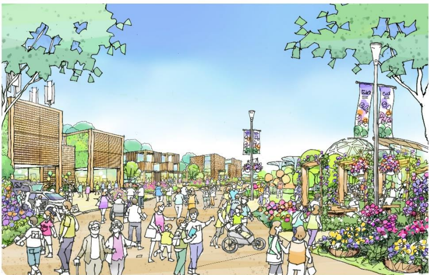
Urban GX Village