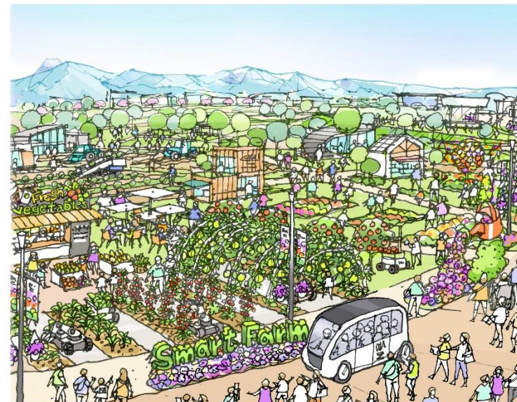
Farm & Food Village

主催者と参加者がテーマ を共有しながら 「幸せを創る明日の風景」 の創出に取り組みます。