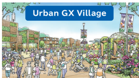
Urban GX Village