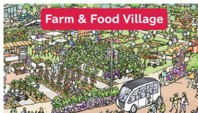
Farm & Food Village

自然と共に生きる知恵と技が込められた、日本の伝統産業などの温故知新を体感できます。