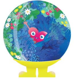
公式マスコットキャラクター トウクントウク