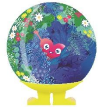
公式マスコットキャラクター 「トウンクトウンク」