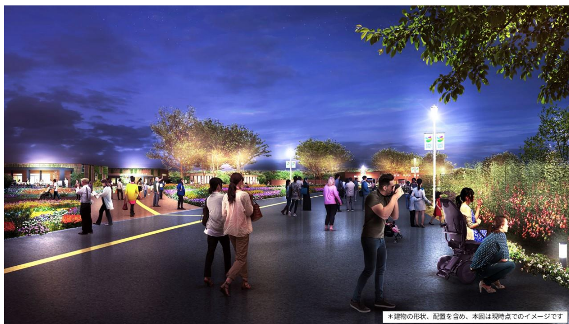
新たに公開した会場イメージ CG (Farm & Food Village 夜景)