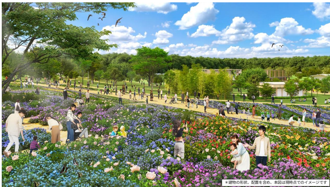
*建物の形状、配置を含め、本図は現時点でのイメージです