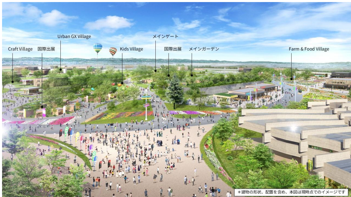
新たに公開した会場イメージCG (テーマ館上空から北西を望む)

今後とも、出展準備がさらに加速するよう、出展者の皆様とコミュニケーションを図りながら、本博覧会の開催に向けた準備を進めて参ります。