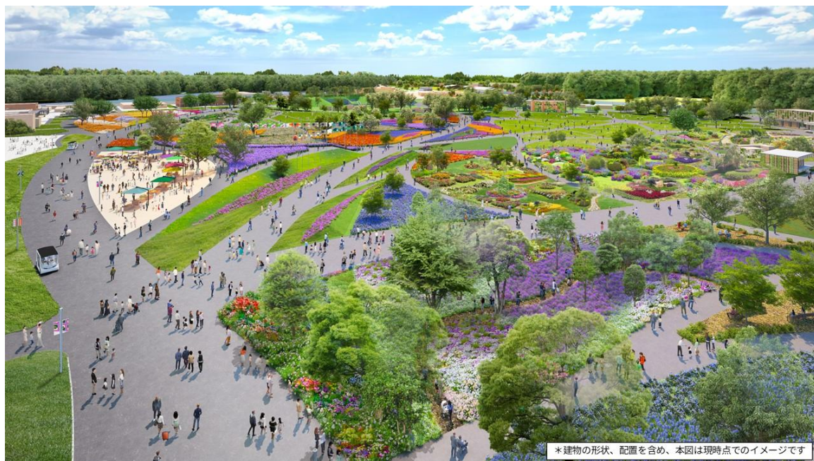
新たに公開した会場イメージ CG (メインガーデン)