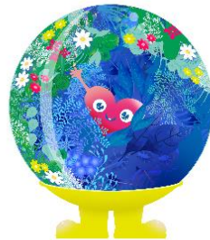
公式マスコットキャラクター 「トゥンクトウンク」