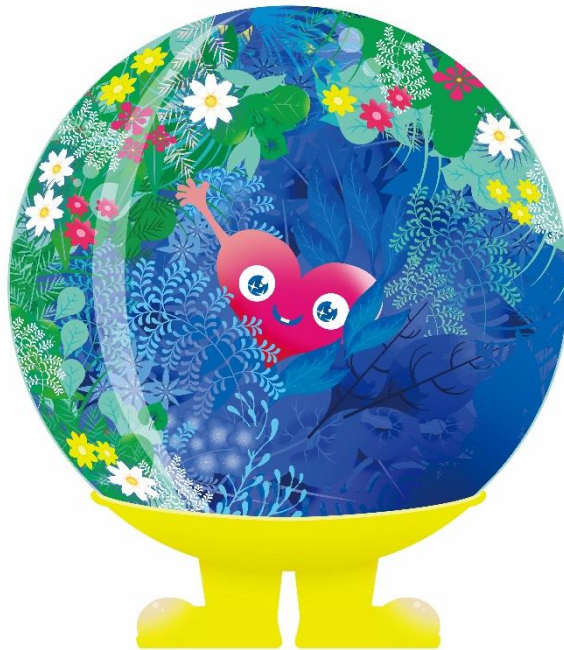
公式マスコットキャラクター 「トゥンクトゥンク」

これらの取組により、2027年国際園芸博覧会の魅力発信、全国的な機運醸成を進めていきます。