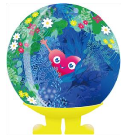
公式マスコットキャラクター 「トゥクトゥク」