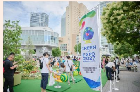
GREEN×EXPO 2027 開催1000日前イベント