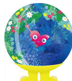
公式マスコットキャラクター 「トゥンクトゥンク」